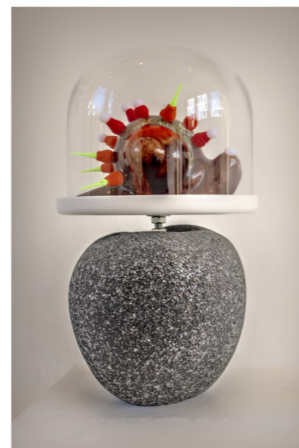
7 Vincent Marquant Exposition Zone de résonances, du 5 mai au 10 juin 2023